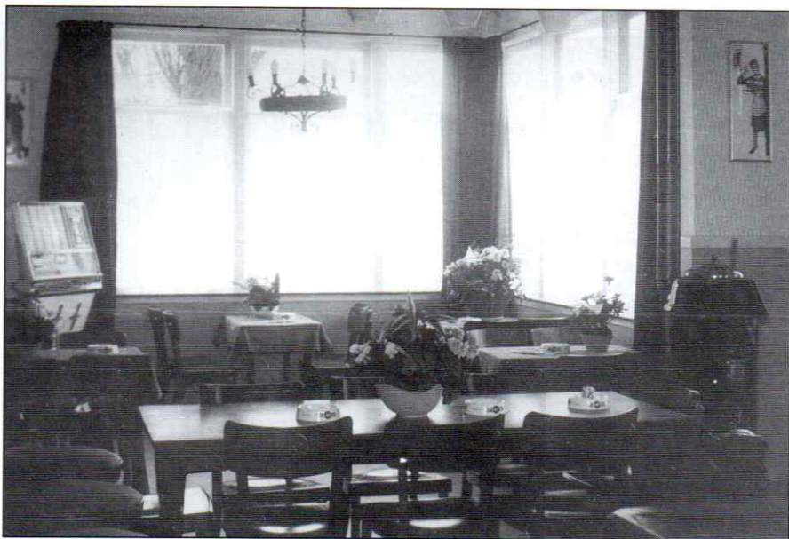
Interieur van het café. Links een jukebox, rechts een kolenkachel.

In september 1925 vraagt de heer Otten weer een bouwvergunning aan. Nu voor een te bouwen schuur achter de melksalon. Deze moest dienst gaan doen als bergruimte, maar zal later ook worden gebruikt als